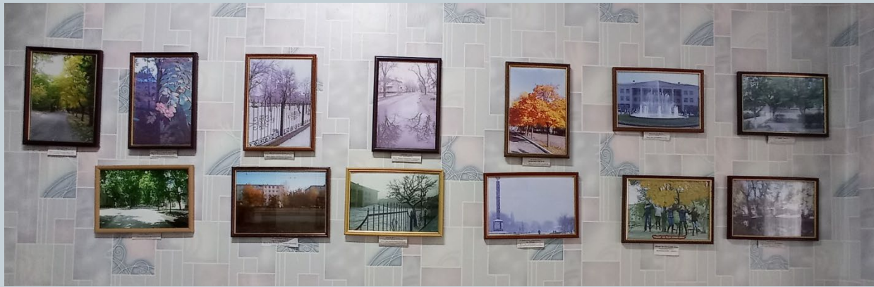
Фотовиставка «МОЄ МІСТО»