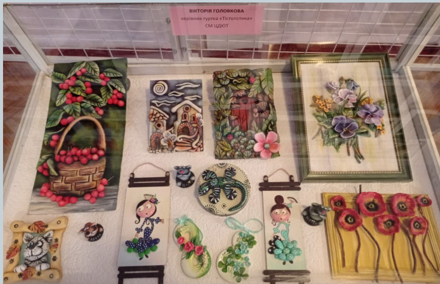
Виставка творчих робіт педагогів «СКРИНЬКА НАТХНЕННЯ»