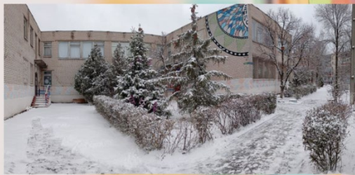
Северодонецький міський Центр дитячої та юнацької творчості

м. Северодонецьк, вул. Гагаріна, буд. 101-6